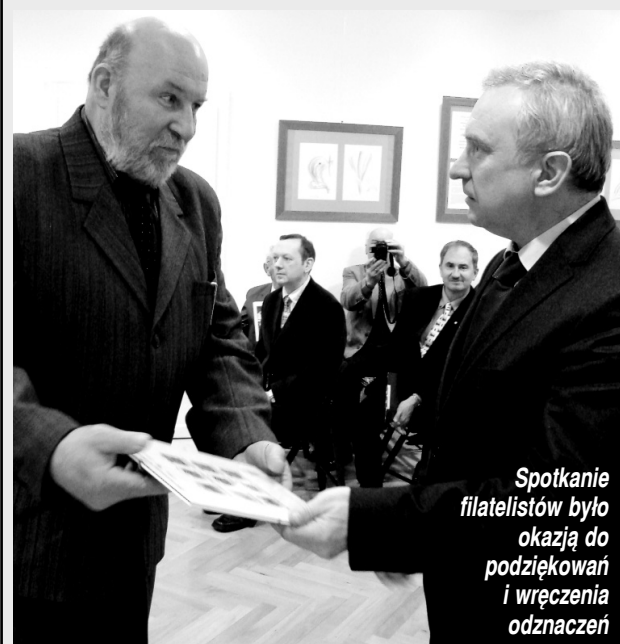
Spotkanie filatelistów było okazją do podziękowań i wręczenia odznaczeń