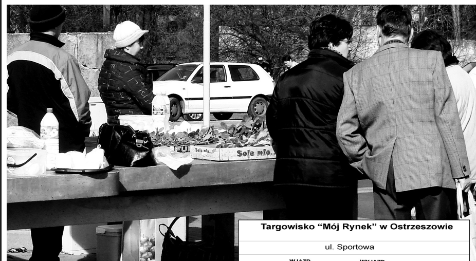
Targowisko „Mój Rynek” w Ostrzeszowie