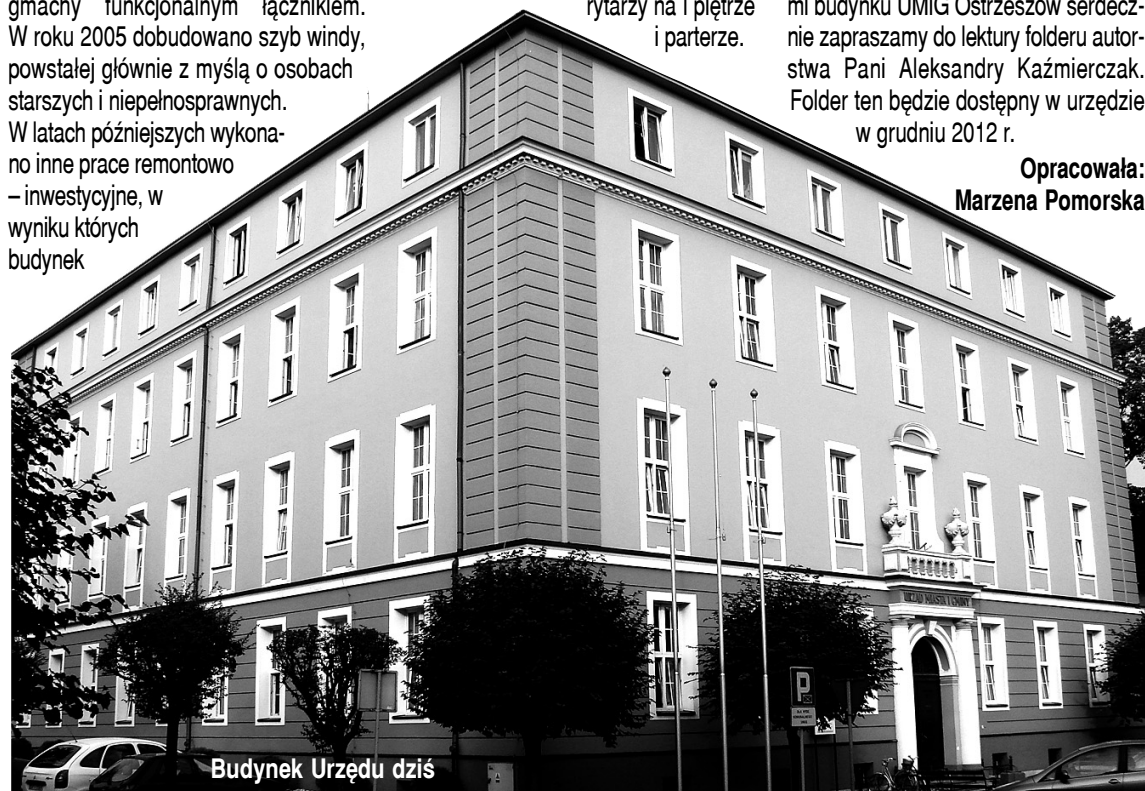
Budynek Urzędu dziś

Urzędu zyskał nie tylko na urodzie, ale i na funkcjonalności m.in. poprzez odnowienie elewacji zewnętrznej, remont dachu wraz z wymianą okien, budowę garaży dla samochodów służbowych, wykonanie parkingu, położenie nowej nawierzchni na podwórzu, poprawę wyglądu otoczenia zewnętrznego, remont korytarzy na I piętrze i parterze.