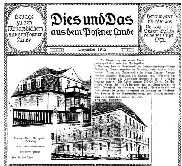
„Dies und Das aus dem Posener Lande”, XII 1912 r., na zdjęciu dom sędziego (po lewej) oraz gmach sądu

Obecnie budynek Urzędu Miasta i Gminy w Ostrzeszowie, ze względu na swoją wartość historyczną i architektoniczną został włączony do gminnej ewidencji zabytków utworzonej mocą Zarządzenia nr 76 Burmistrza MiG Ostrzeszów z dnia 29 października 2010 r..