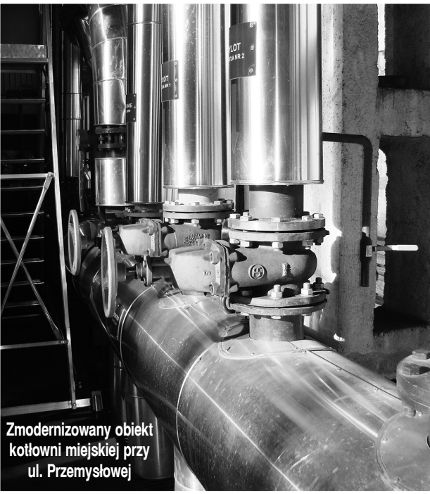
Zmodernizowany obiekt kotłowni miejskiej przy ul. Przemysłowej